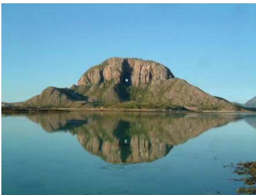
Torghatten, Brønnøy Kommune