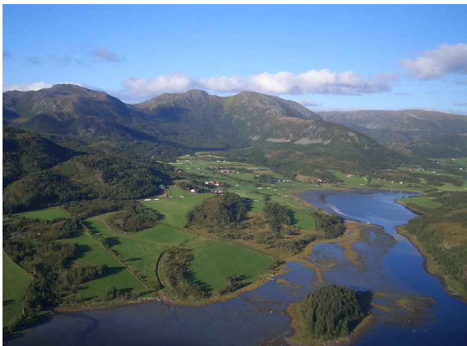
Kvervet, Brønnøy Kommune

Med 1039 kvadratkilometer er ikke kommunen blant de største, men kan til gjengjeld vise frem en rik og variert natur, fra øyriket i vest via frodige bygder og skogdaler til høgfjellet i øst. Fra ytterste skjær i vest, til Tosenfjellet i øst er det mer enn 100 km. Sommeren 2009 ble en stor del av dette arealet vernet gjennom etableringen av Lomsdal-Visten nasjonalpark/Njaarken vaarjelimmiedavje . I tillegg har vi vårt mest kjente landemerke; det berømte fjellet Torghatten, som ligger like sørvest om Brønnøysund.