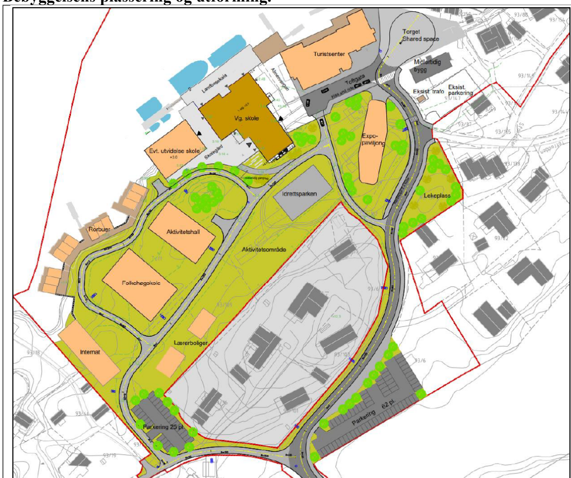
Figur 13: Illustrasjonplan av det sentrale området - alternativet med folkehøgskole.

Illustrasjonsplanen viser forslag til ny bebyggelse på området. Illustrasjonsplanen tar utgangspunkt i et maksalternativ til utbygging i form av blant annet folkehøgskole med tilhørende internat og aktivitetstall, personalboliger, rorbuer og etablering av vg-skole/fagskole med tilhørende mulig skoleutvidelse, kontor- nærings- og restaurantvirksomhet, samt etablering av Expo-paviljong (fra Dubai 2020) m.m. Illustrasjonen er ikke juridisk bindende, men viser kun en mulig utbygging av området.