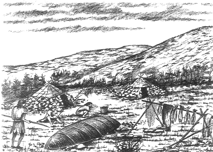
Tegninger av: Ragnvald Grjøtheim

Vurdering: Stor regional verdi – steinalderboplassene viser en lang tidsperiode og de er lite forstyrret av moderne aktivitet.